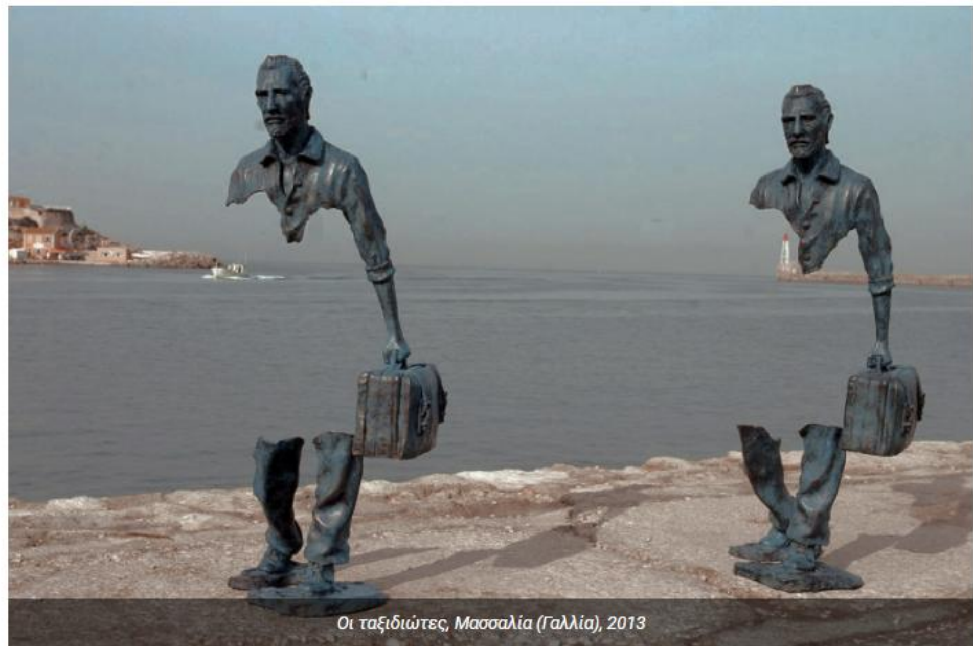
Οι ταξιδιώτες, Μασσαλία (Γαλλία), 2013