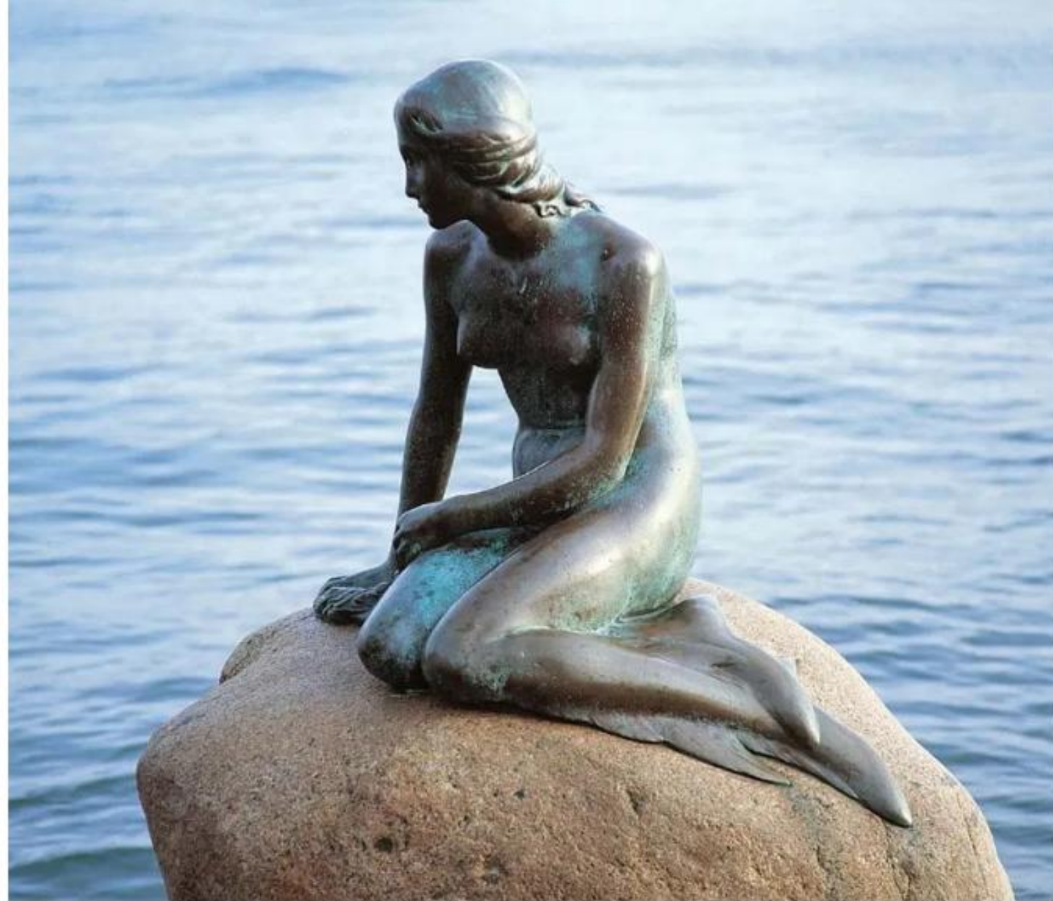
3. Η Μικρή Γοργόνα.