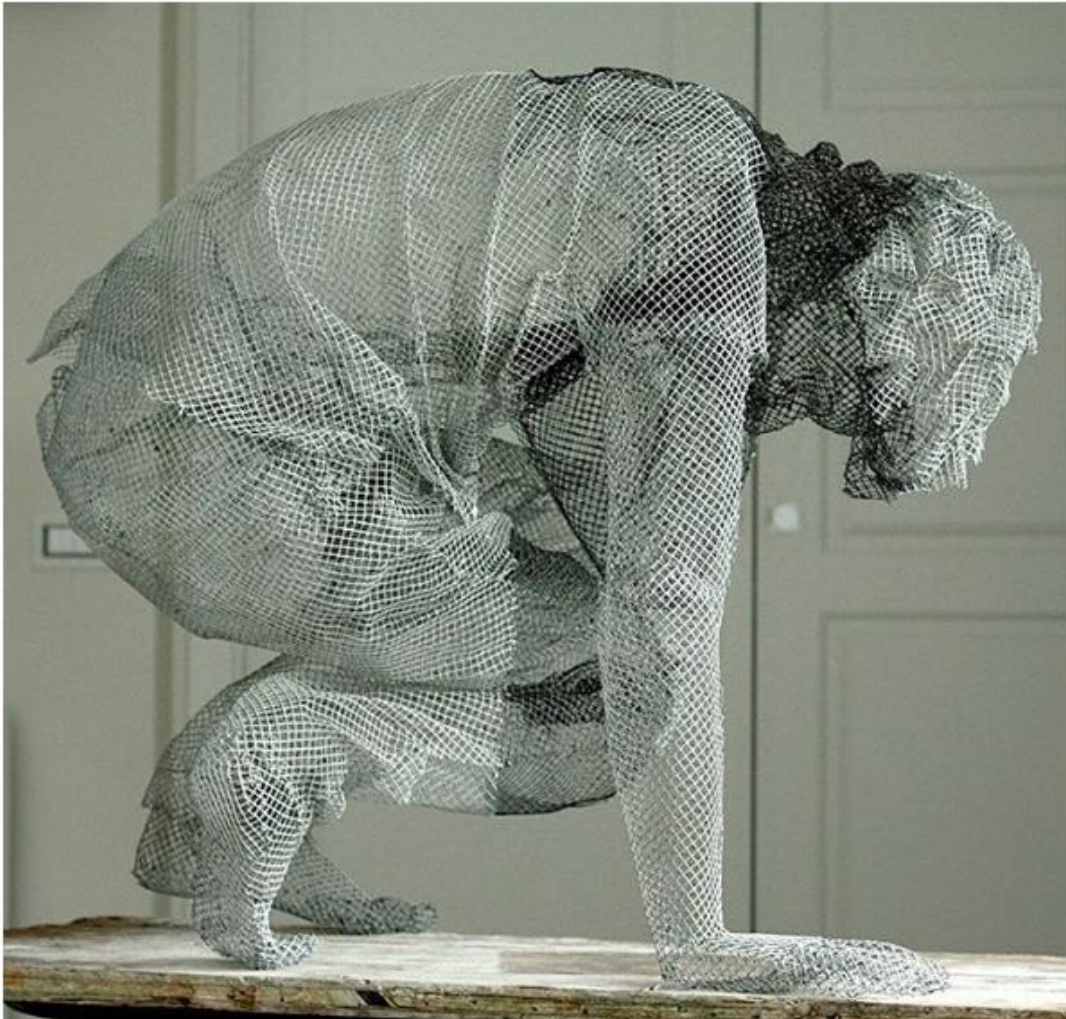
Συρμάτινο γλυπτό του Εντοάρντο Τρεσόλντι