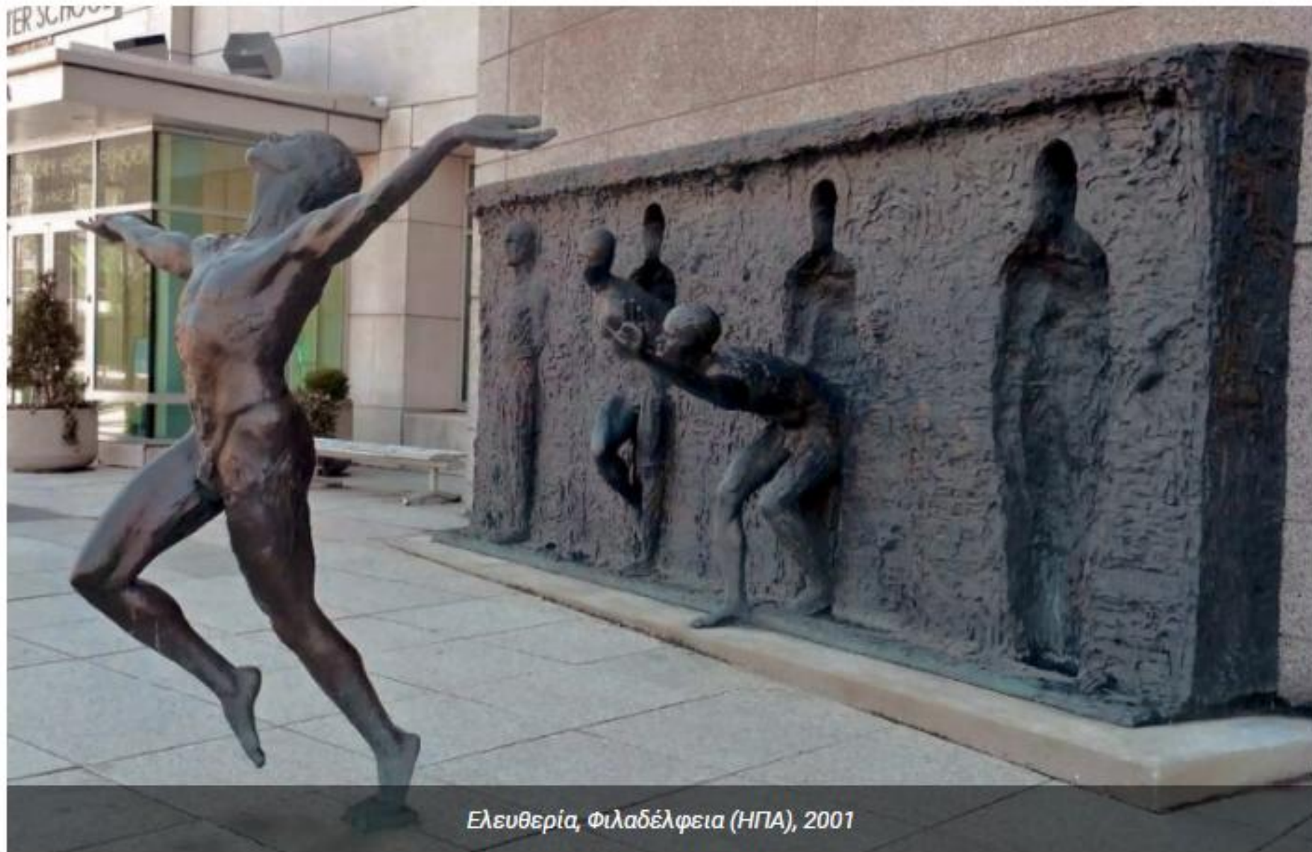
Ελευθερία, Φιλαδέλφεια (ΗΠΑ), 2001