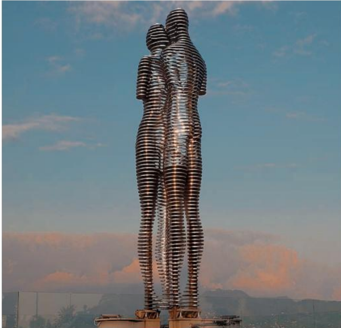
1. Statue of love (Το άγαλμα του έρωτα) από την Tamara Kvesitadze , Μπατούμι (Γεωργία), 2010