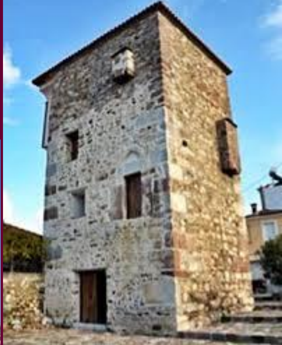
Πύργος Τσουκαλαδέλλη θερμή